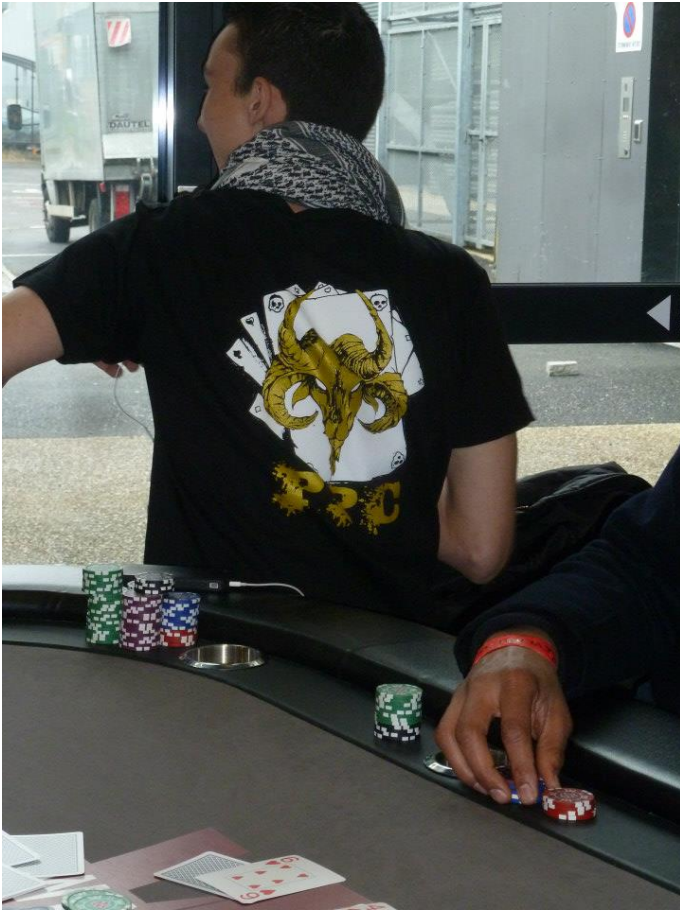
Willy29 un des jeunes joueurs de notre club représentant le club à un tournoi de poker